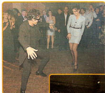
Sopra, Teo Teocoli (53 anni) mentre canta nella discoteca allestita per l'occasione in una delle sale del castello.