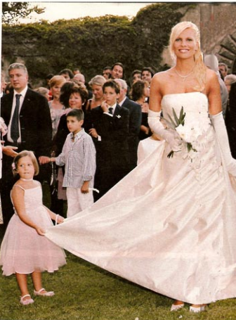
di Aldo Dalla Vecchia.